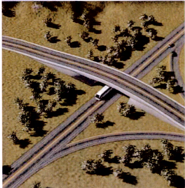
Tramo 1: Puerto Salgar - Girardot