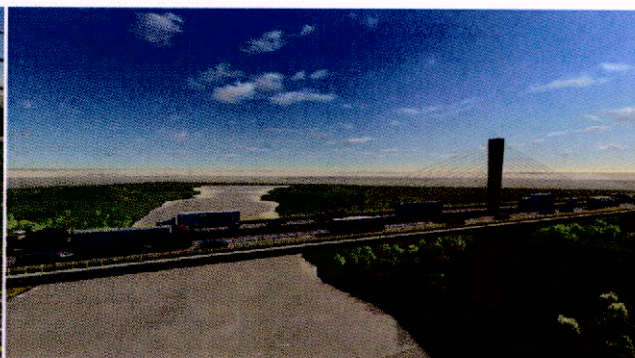
Imágenes: Puente atirantado en doble calzada – Municipio de Flandes