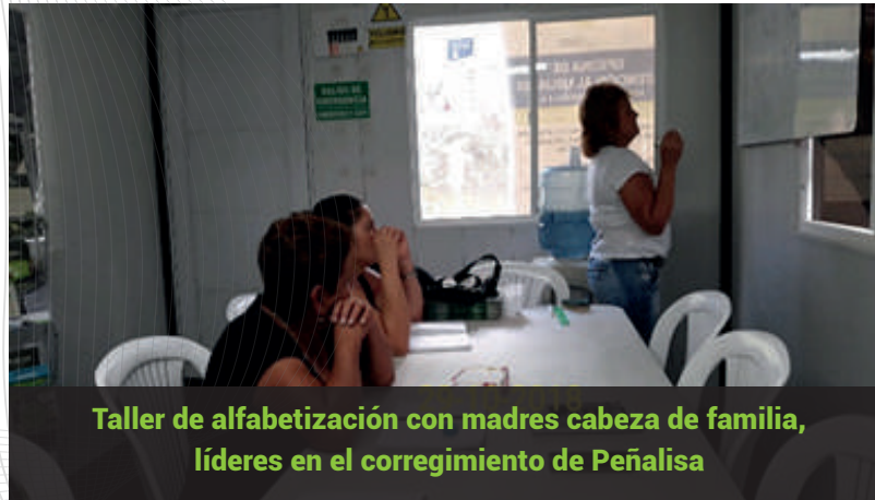
Taller de alfabetización con madres cabeza de familia, líderes en el corregimiento de Peñalisa