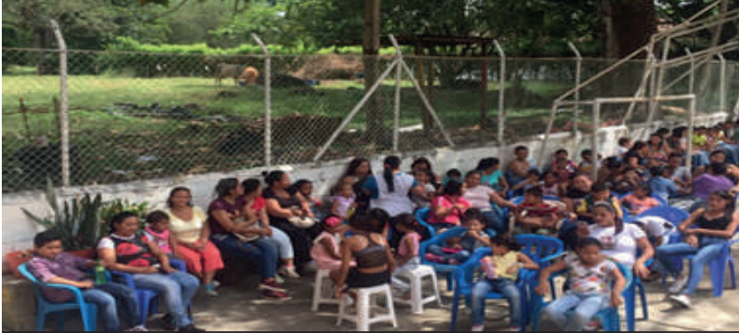
Cine al parque en el corregimiento de Puente Iglesias