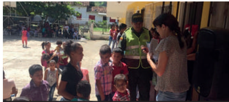
Jornada de cine en el barrio Quebrada Larga en el municipio de Tarso