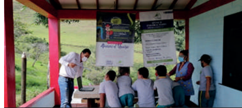
Cine en la Institución Educativa Rural Mulaticos en el municipio de Tarso