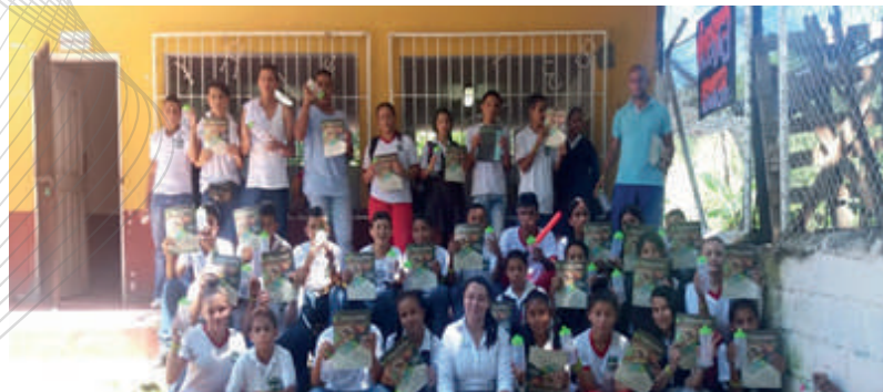
Cine en la Institución Educativa Rural en el corregimiento de Puente Iglesias