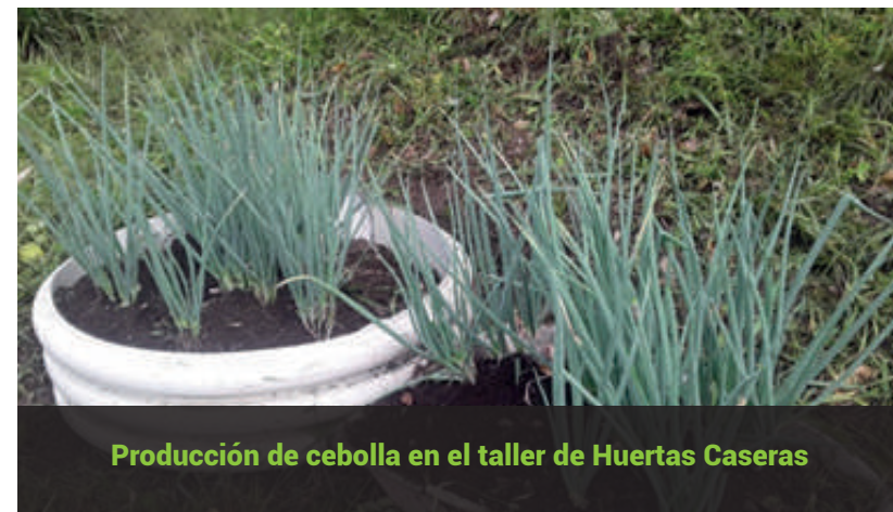
Producción de cebolla en el taller de Huertas Caseras