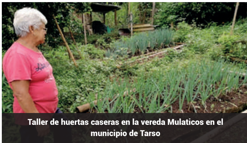
Taller de huertas caseras en la vereda Mulaticos en el municipio de Tarso