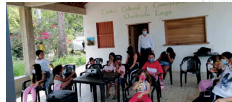
Jornada de cine en la caseta comunal Quebrada Larga en el municipio de Tarso