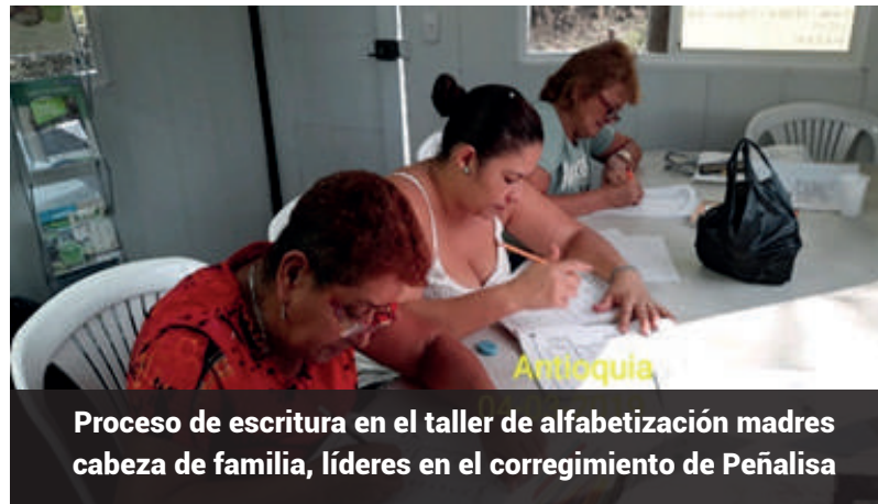
Proceso de escritura en el taller de alfabetización madres cabeza de familia, líderes en el corregimiento de Peñalisa