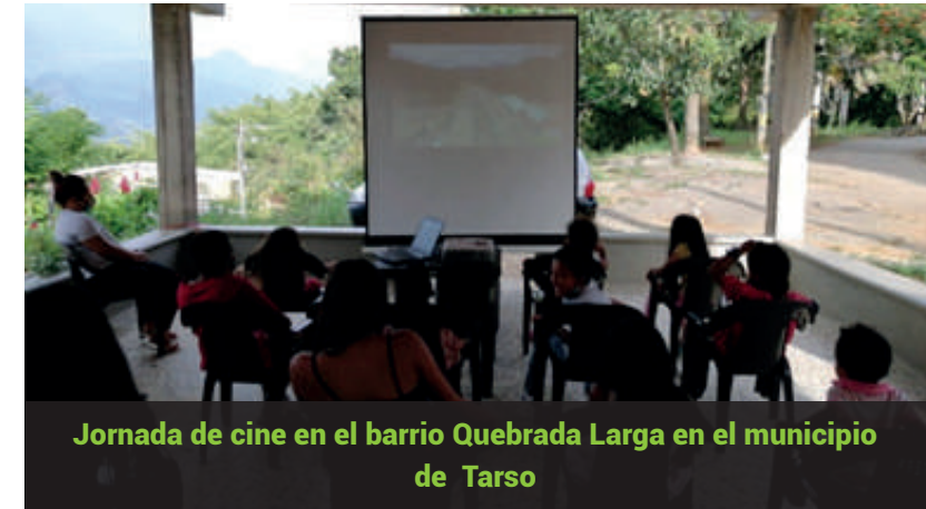
Jornada de cine en el barrio Quebrada Larga en el municipio de Tarso