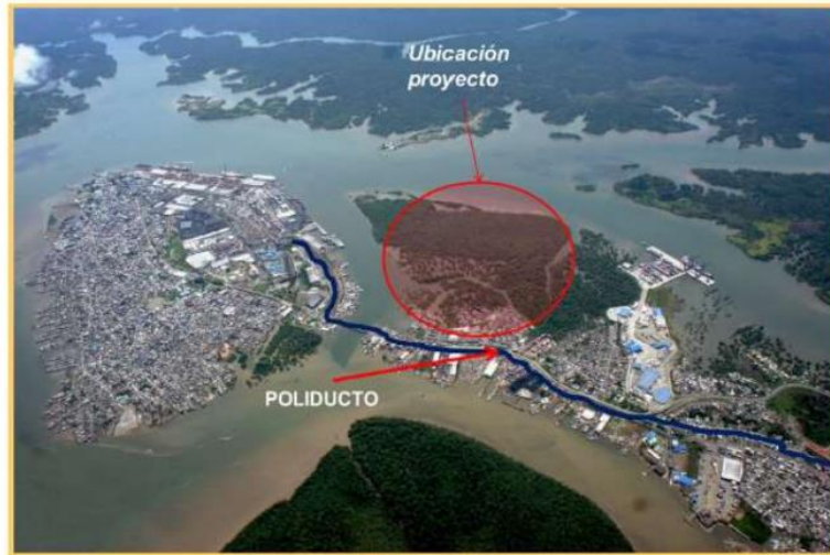
Imagen 1 Ubicación del Proyecto Puerto Solo